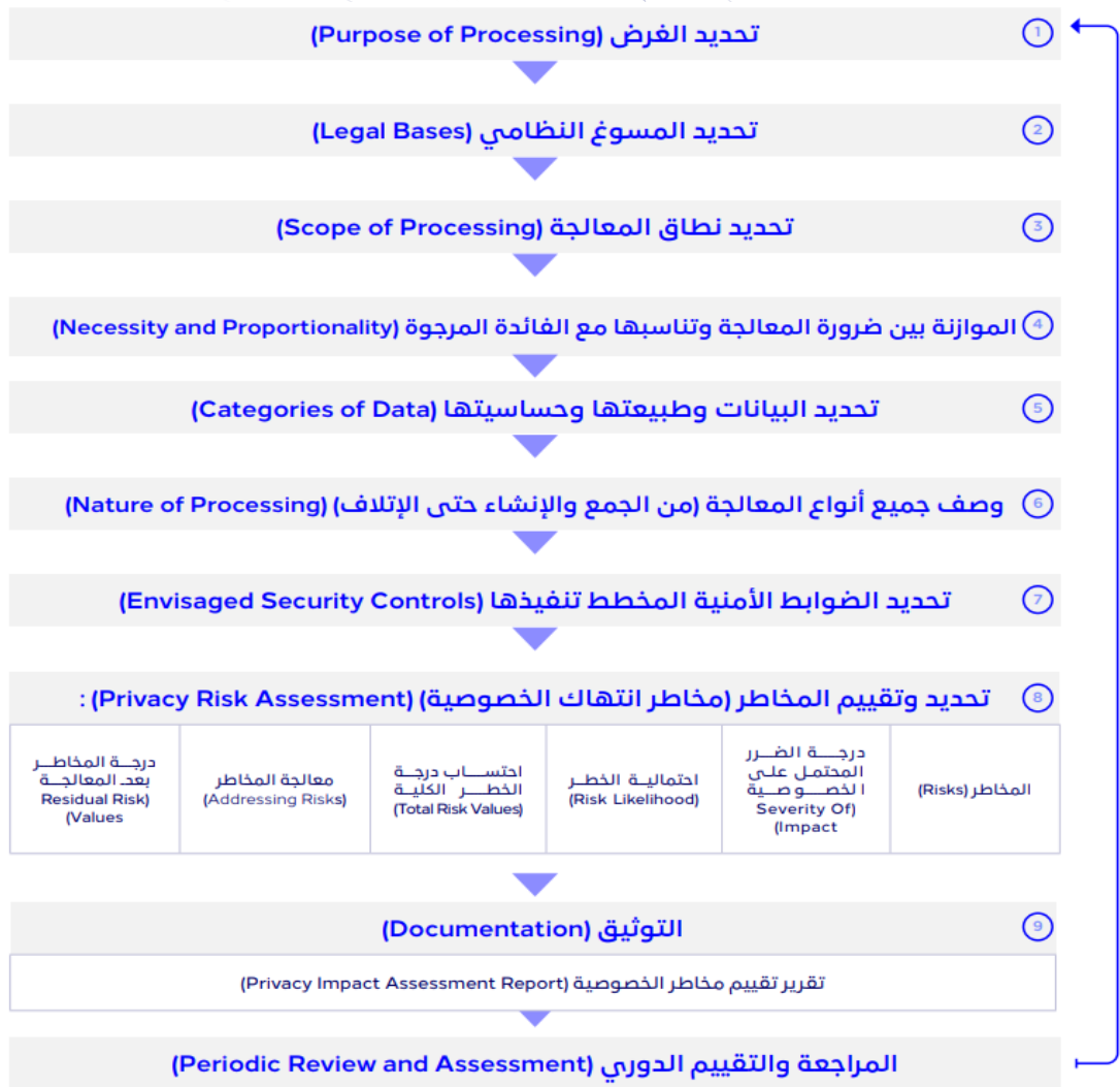
الشكل 1: الخطوات التفصيلية لإجراء عملية تقييم مخاطر الخصوصية

تبدأ عملية تقييم مخاطر الخصوصية بالقيام بمراجعة الوثائق ذات العلاقة بالمشروع المتعلقة بعمليات المعالجة للبيانات الشخصية، لتنفيذ الفقرات التالية، وقد تشمل هذه الوثائق، خطة المشروع، العقود بين الجهات الأخرى، تقارير التقييم الفنية، والمواصفات الوظيفية للأنظمة المستخدمة وغيرها. الرسم التوضيحي التالي يوضح الخطوات التفصيلية لإجراء عملية تقييم مخاطر الخصوصية.