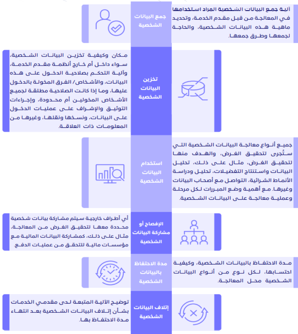
الشكل 3: مراحل معالجة البيانات

في هذه المرحلة يتم تحديد كيفية جمع البيانات الشخصية، ومعالجتها؛ حيث يتم توضيح آلية تدفقها بمراحل المشروع المتعلق بعمليات المعالجة، من جمعها حتى إتلافها، وتشمل هذه المراحل بحد أدنى التالي: