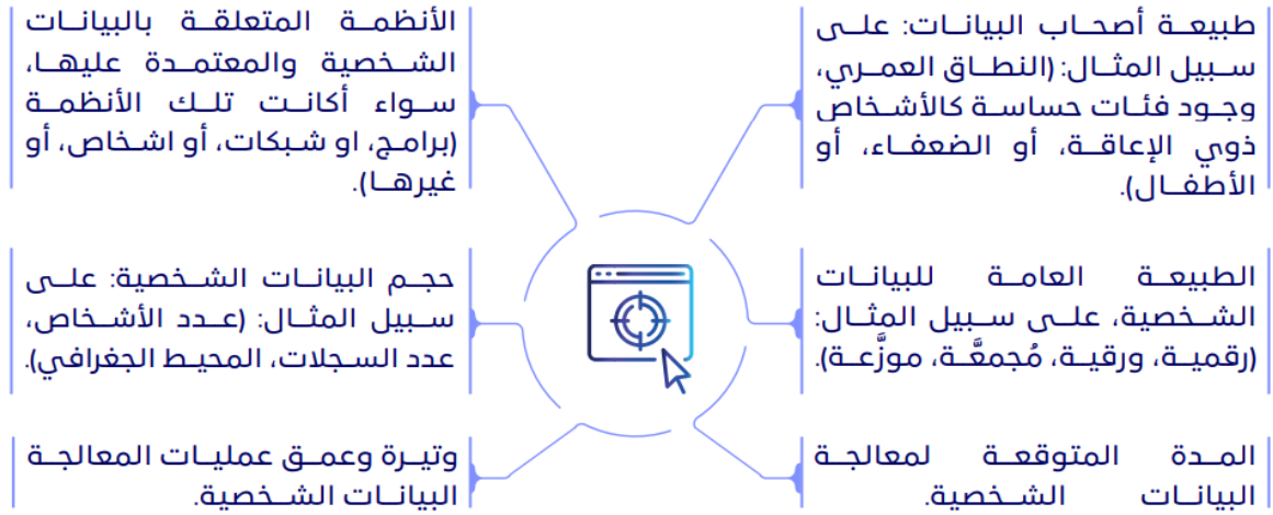
الشكل 2: تحديد نطاق المعالجة