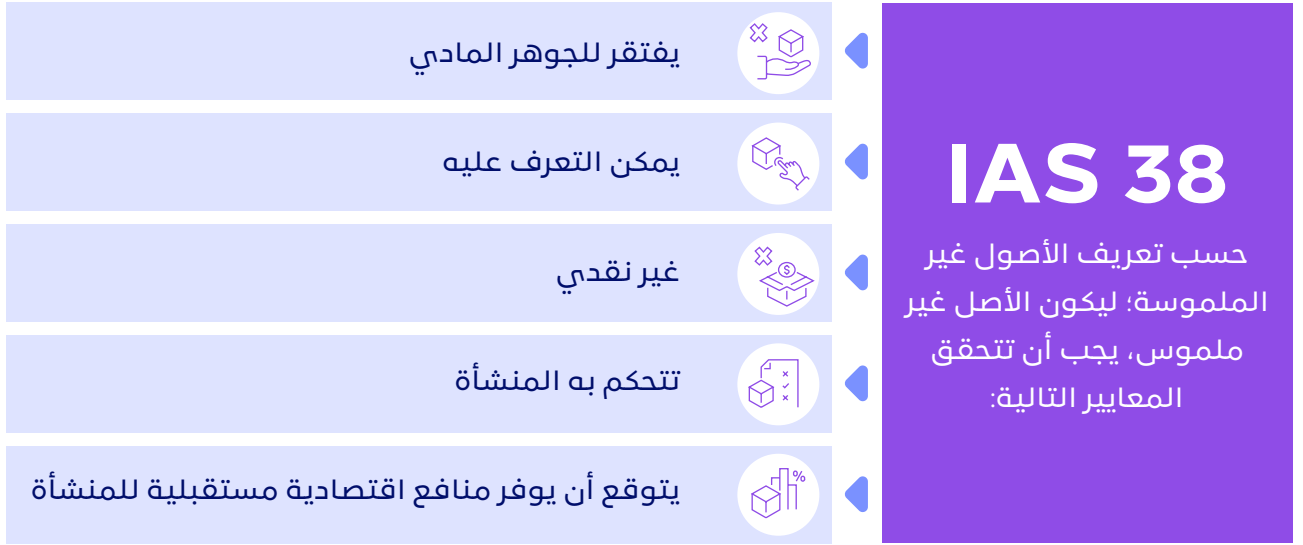
الشكل رقم (4): تقييم الأصول غير الملموسة

تمتلك معظم الشركات العاملة في صناعة الألعاب، على سبيل المثال، أصولاً غير ملموسة في ميزانيتها العمومية. على الرغم من أن الأصول غير الملموسة لا تحتوي على جوهر مادي ملموس، إلا أنها يمكن أن تكون عنصرًا مهمًا للشركات لتكون قادرة على العمل بنجاح. ومن الأمثلة لهذه الأصول المنصات والألعاب والبرامج الأخرى الخاصة بعمليات الشركة.