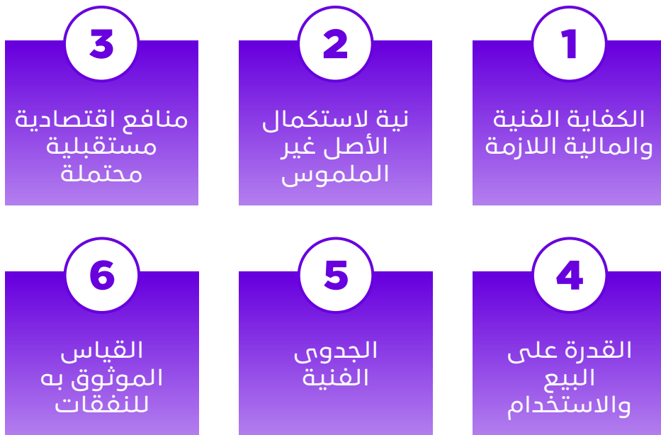
الشكل رقم (6): شروط إثبات الأصول غير الملموسة