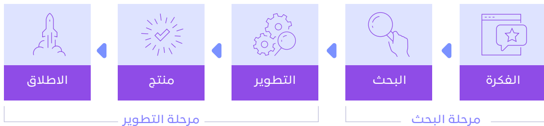
الشكل رقم (5): تصنيف توليد الأصول -مرحلتي البحث والتطوير

ومجمل القول، بالإضافة إلى الامتثال لمعايير التأهل كأصل غير ملموس ومعايير المحاسبة المذكورة أعلاه، لتقييم ما إذا كانت الأصول غير الملموسة المنتجة داخليًا تفي بمعايير الاعتراف، فإنه يتعين على المنشأة تصنيف توليد الأصول إلى مرحلتين: مرحلة البحث ومرحلة التطوير.